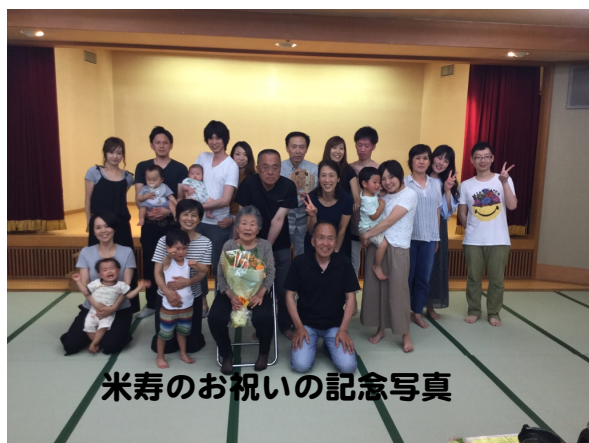
米寿のお祝いの記念写真