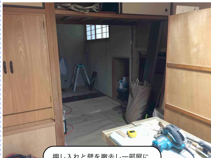
押し入れと壁を撤去し一部屋に

昨年父が亡くなり、母も90歳が近づいてきていることもあり、いよいよ実家に同居することにしました。とは言っても二世帯分の荷物を一世帯に収めないといけないので大変です。引っ越しに向けて家内が実家の片付け始めましたが、ま～いろいろと不要品があります。父が亡くなっ