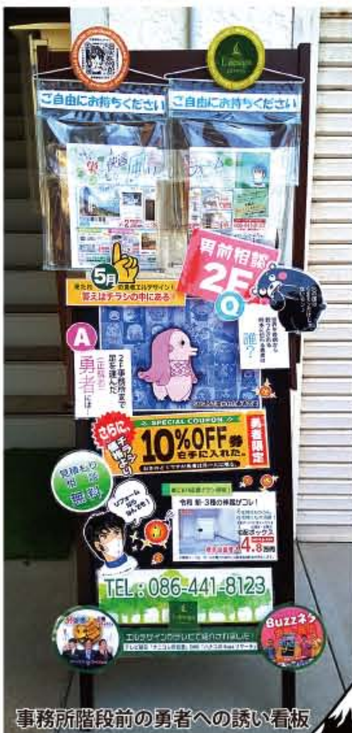
事務所階段前の勇者への誘い看板

ご近所の方からミモザを たくさん頂いたので 事務所の花瓶におすそ分け！ と思ったら花瓶に生けるのが なかなか難しく、 ドライフラワーに初挑戦！