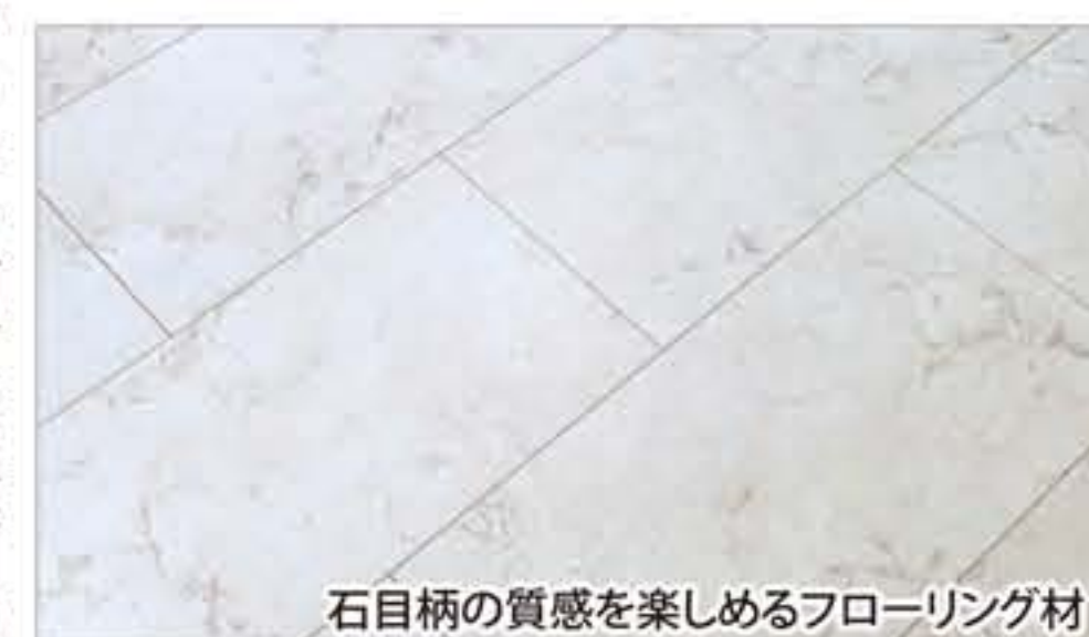
石目柄の質感を楽しめるフローリング材